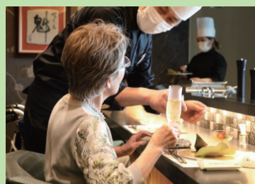
和・洋・中 選べる6つの レストランとメニュー