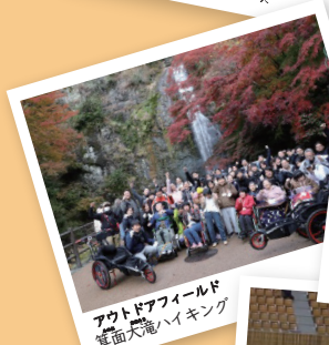
アウトドアフィールド 真面大滝ハイキング