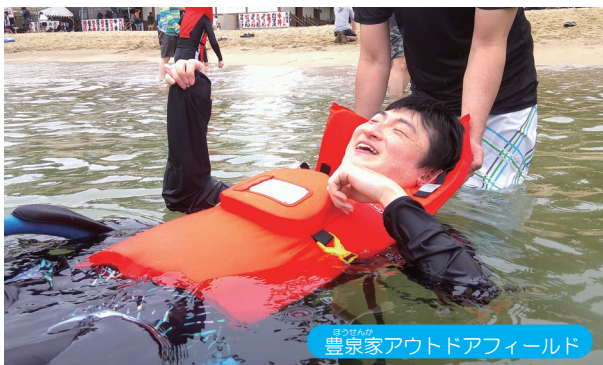
豊泉家アウトドアフィールド