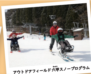
アウトドアフィールド六甲スノープログラム