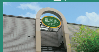
大阪府豊中市末広町3-2-27